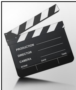
Les élèves du CVC ont appris le montage vidéo avec un pro !