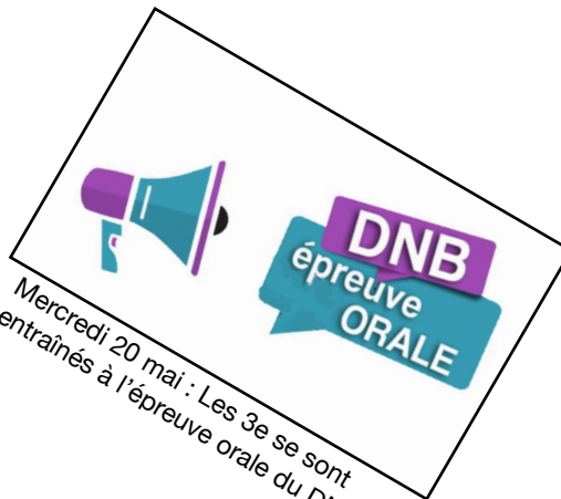
Mercredi 20 mai : Les 3e se sont entraînés à l'épreuve orale du DNB.