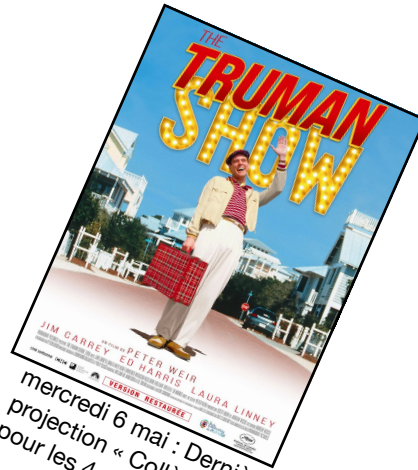
mercredi 6 mai : Dernière projection « Collège au Cinéma » pour les 4e1 et 4e5