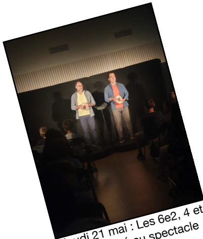
Jeudi 21 mai : Les 6e2, 4 et 5 ont assisté au spectacle Téklash.

P.4 : Des histoires qui racontent un métier !