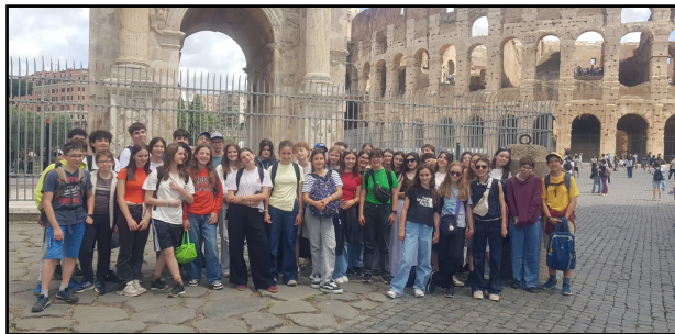
Voyage en Italie pour les 4e italianisants